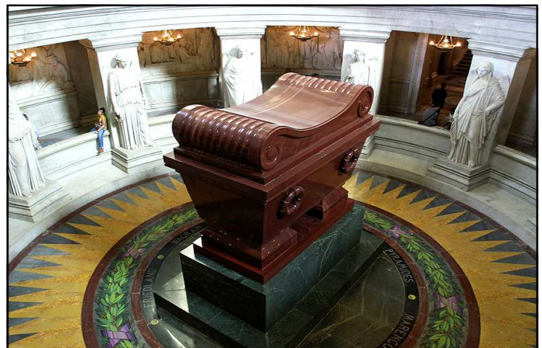
Tombeau de Napoléon - Invalides à Paris