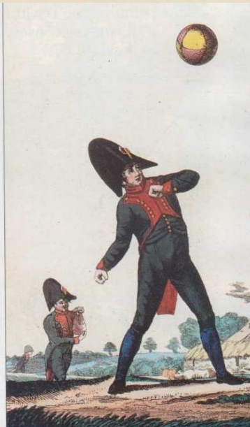
Élève du lycée Napoléon, 1807-1813.

D'après Reichardt, Lettre, 17 décembre 1802.