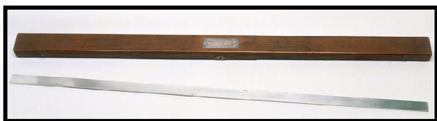
Le mètre étalon de Lavoisier