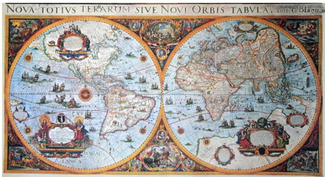
Carte de la fin du XVII siècle