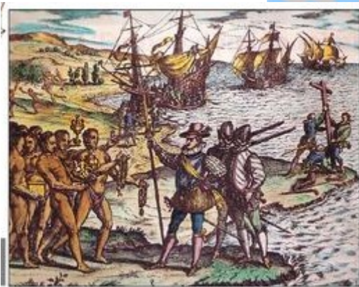
Doc' 6 : Arrivée de Christophe Colomb en Amérique - gravure - XVI e siècle

Quelle erreur conduit Christophe Colomb à entreprendre son voyage ?