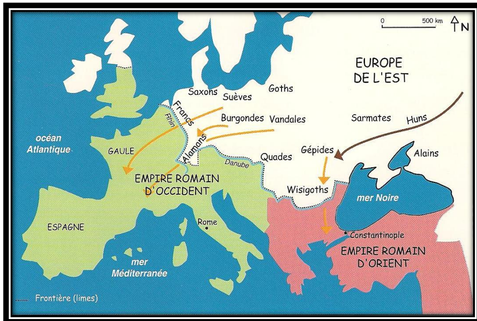
Doc 2 : les invasions barbares au IV ème siècle