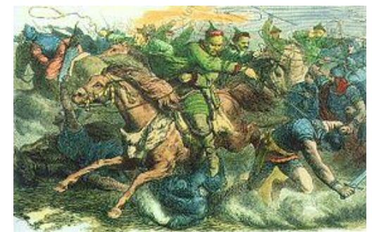
Les Huns au combat contre les Alains : illustration de Geiger (1873)

Les peuples qui vivaient au nord et à l'est de la Gaule l'ont envahie au IV ème siècle. Ces barbares, notamment les Francs, ont constitué de nombreux royaumes en Europe. Les civilisations Gallo-Romaines et barbares se sont mélangées pour donner naissance à une nouvelle civilisation dont la France est héritière. Cette période marque la fin de l'Antiquité et le début du Moyen Âge.