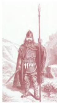
Guerrier franc armé d'une framée