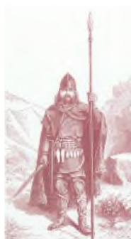
Guerrier franc armé d'une framée