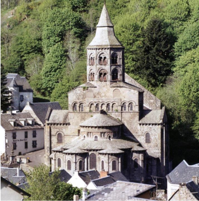
Une église romane : Notre Dame d'Orcival, Auvergne, 12 e siècle