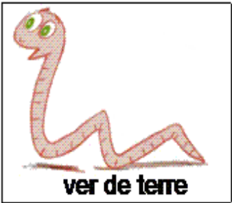
ver de terre