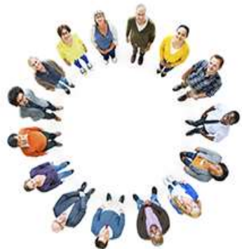
Une devise : Unie dans la diversité