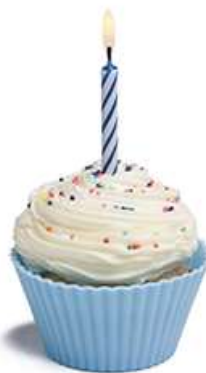
Journée de l'Europe, le 9 mai

L'Union européenne se reconnaît grâce à divers symboles, le plus célèbre étant le cercle d'étoiles d'or sur fond bleu. Les douze étoiles disposées en cercle sur le drapeau symbolisent les idéaux d'unité, de solidarité et d'harmonie entre les peuples d'Europe.