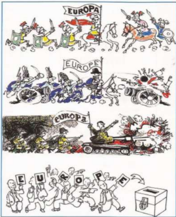
L'Europe vue par Plantu en 1992