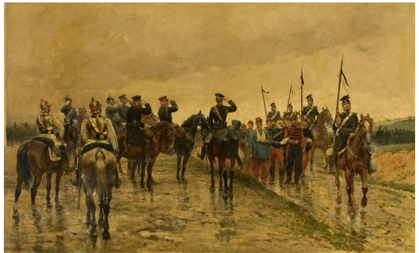
Guerre franco-allemande, 1870 (Le salut aux blessés)