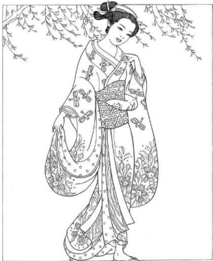
19. Darting Dragonflies Kimono

2. Ecris son nom sous chaque illustration : un kimono – le Mont Fuji