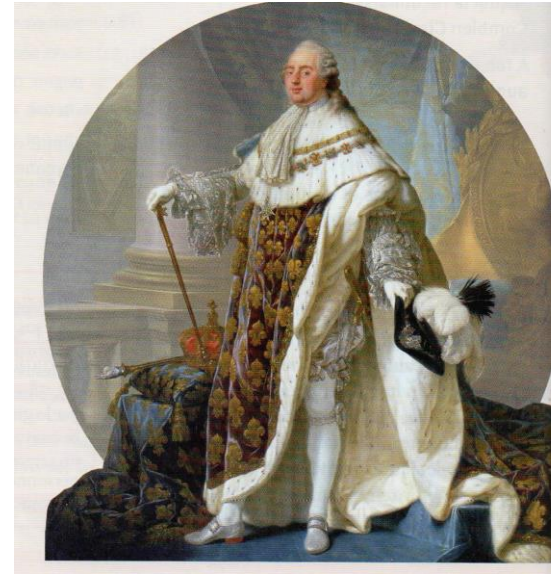
Document 2: Le début de la royauté Le roi Louis XVI, tableau de 1779

Clovis a été le premier roi de notre pays. A partir de Clovis et jusqu'en 1792, à la mort de Louis XVI (soit durant 1300 ans), la France a toujours été dirigée par un roi.