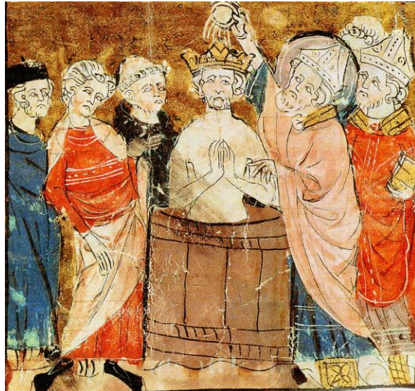
Document 3 : L'alliance avec l'Eglise. Le baptême de Clovis, miniature du 14 ème Siècle