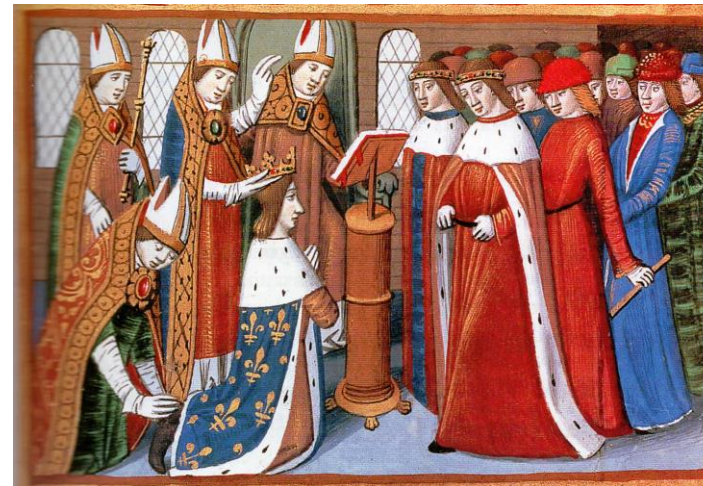
Document 4: Le sacre du roi Charles VII à Reims en 1429, miniature du 15 ème siècle.

Suivant l'exemple de Clovis, tous les rois de France ont été chrétiens et beaucoup sont allés se faire sacrer roi par un évêque à Reims : là où Clovis avait été baptisé. Ils montraient ainsi qu'ils étaient les héritiers de Clovis, affirmaient détenir le pouvoir de Dieu et renouvelaient l'alliance entre l'église et le Roi de France.