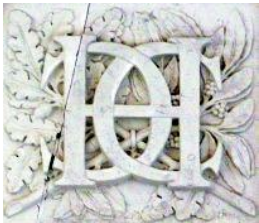
Henri II et Diane de Poitiers

En broderie, le monogramme ou chiffre est le nom des lettres initiales brodées sur les pièces des trousseaux, des mouchoirs ou des draps.