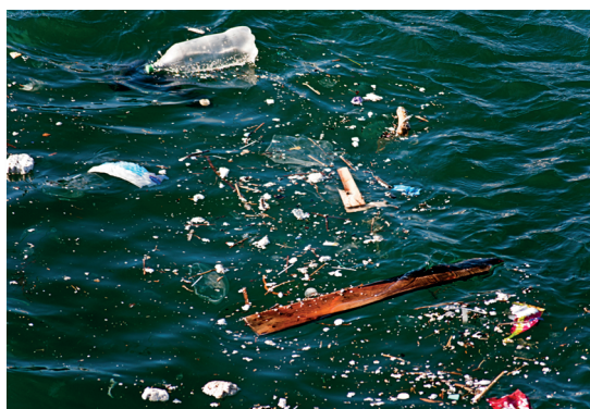
Eau polluée par des déchets ménagers.