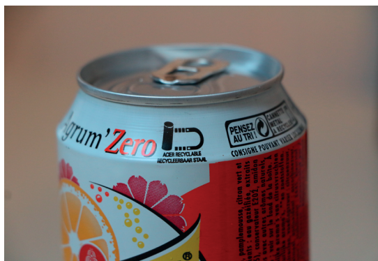
Canette de soda.