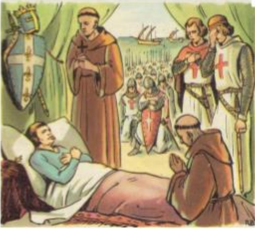
Mort de Louis IX à Tunis lors de sa 2 ème croisade en 1 270

5. Dans quelle ville se termine la deuxième croisade de Louis IX ?