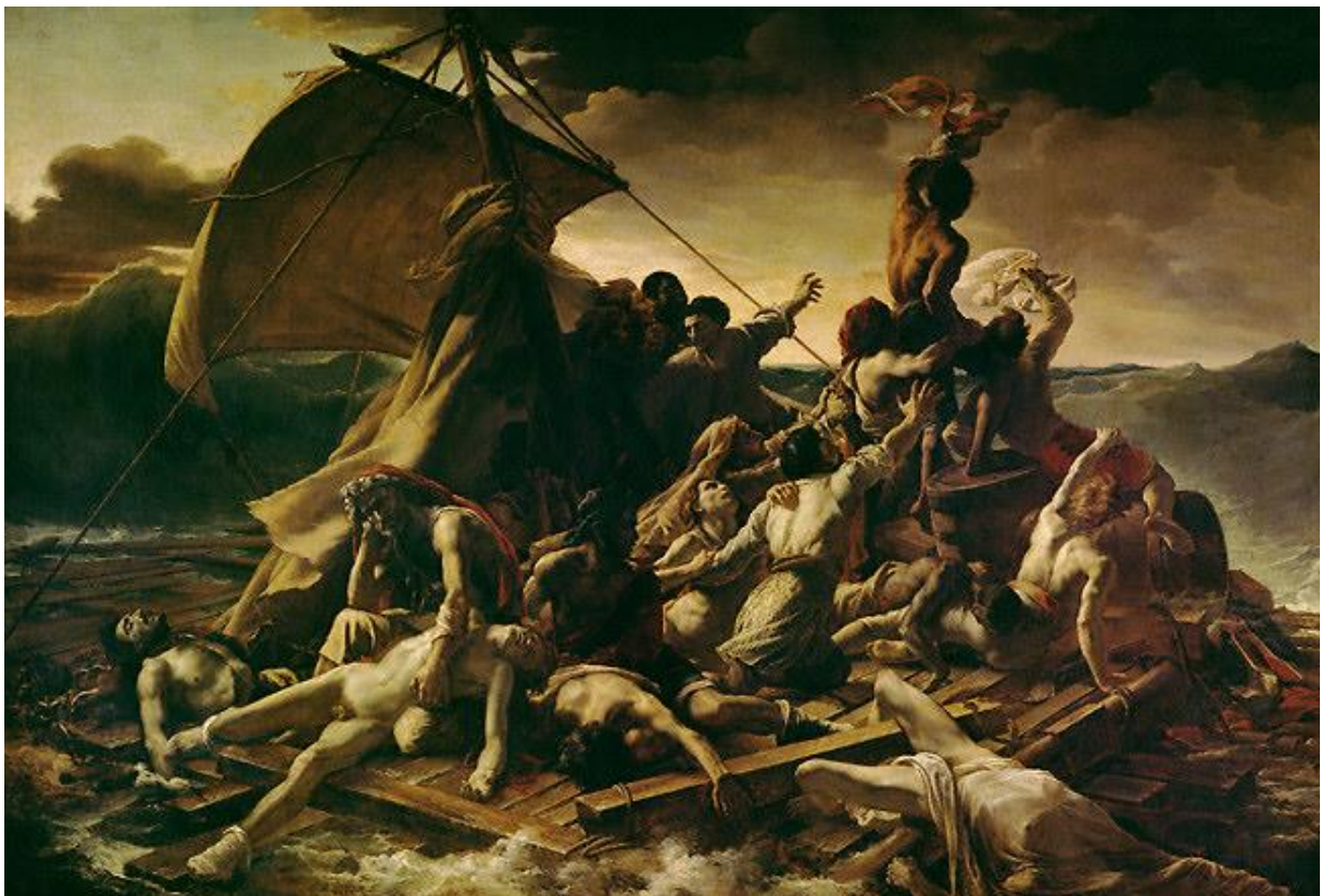
Le Radeau de la méduse, Théodore Géricault, 1819.