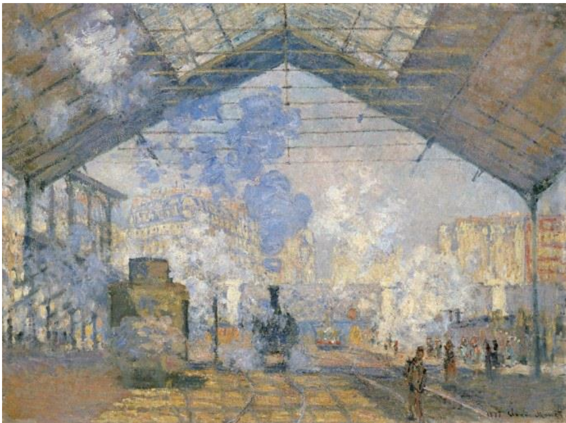
Gare St Lazare, Monet, 1877.