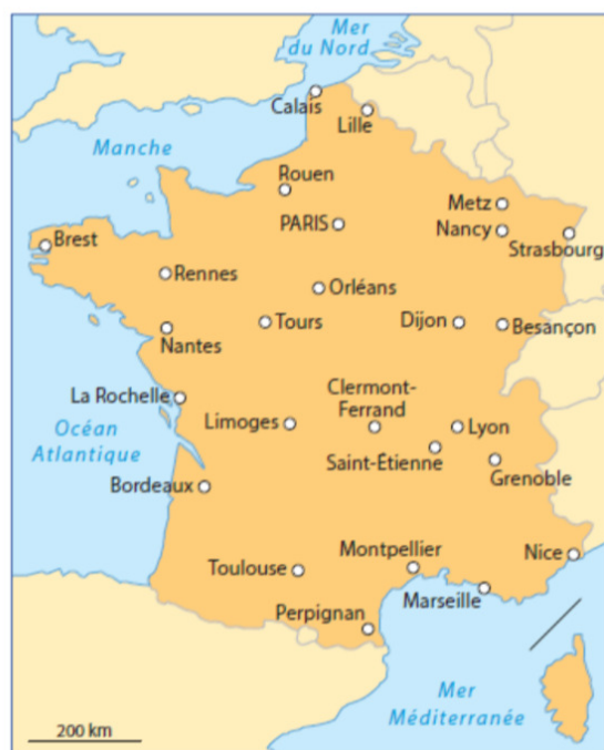
Document 1 • Les grandes villes et les mers de France