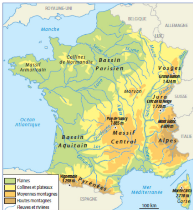
Document 3 • Le relief en France