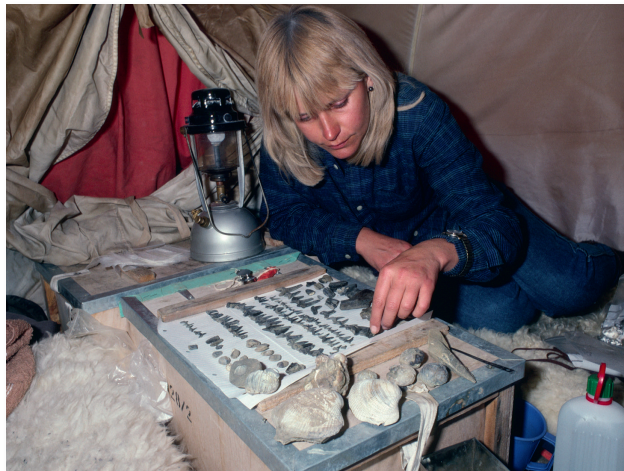
Une paléontologue au travail.