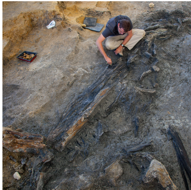
Dégagement de vestiges enfouis dans un sol par un archéologue.