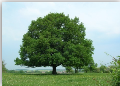
Objet 1 : ARBRE...