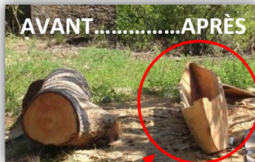
Objet 2 : ... BATEAU ...