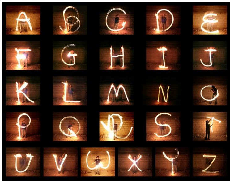
Performance de Nir Tober