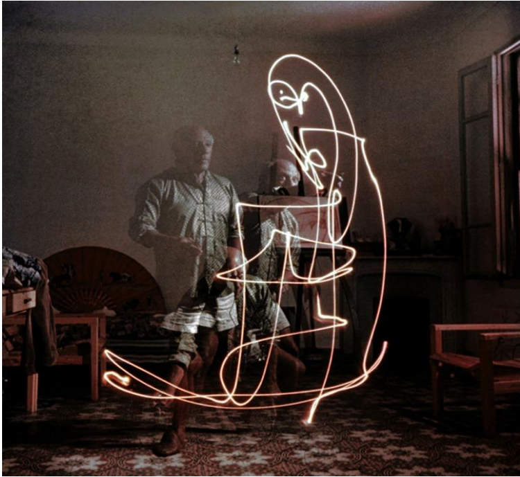
Picasso photographié par Gjon Mili, 1949