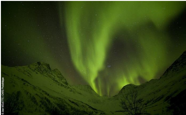
Piège ; Aurore boréale en Norvège, près du glacier Steindalen. Le 14 mars 2010, à environ 70° de latitude nord, dans la région de Tromsø, Alpes de Lyngen.