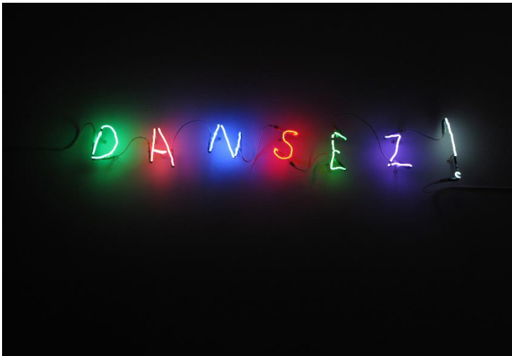
Piège ; Claude Leveque - Néons