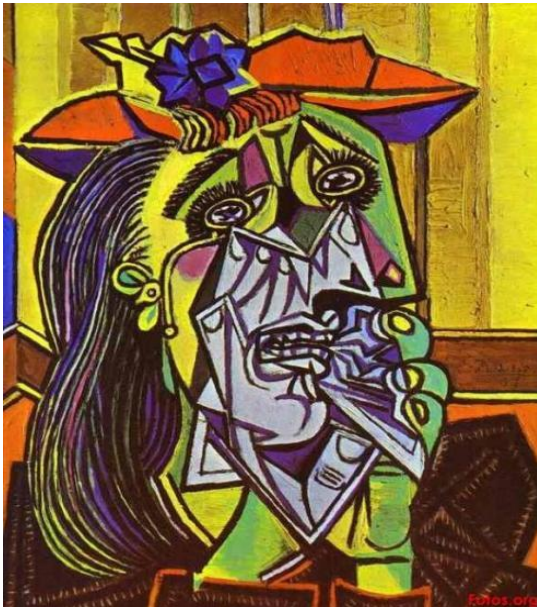
Picasso - La femme qui pleure, 1937