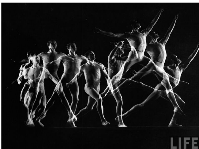
Black and White Movements