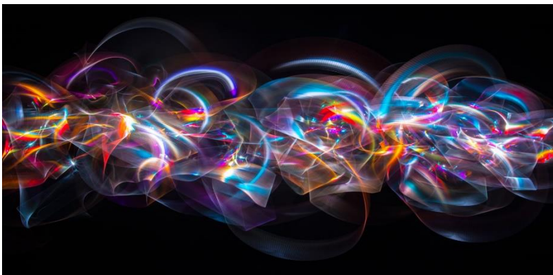
Light Painting Kata – video