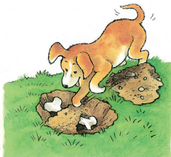
Sam a déterré son os.