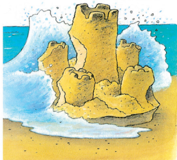
La vague va détruire le château.

Détruire une construction, c'est l'abattre, la réduire en un tas de pierres. Un tremblement de terre a détruit le village. Synonymes : démolir, dévaster. Contraire : construire. ● Mot de la même famille : destruction.