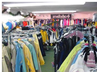
the clothes shop