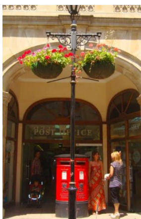
the post office