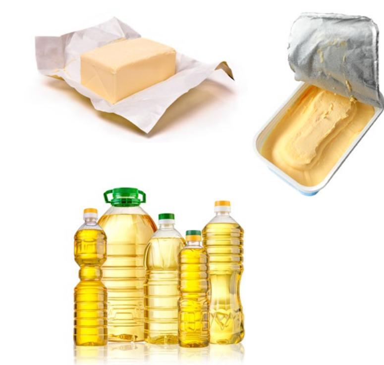
LES MATIÈRES GRASSES