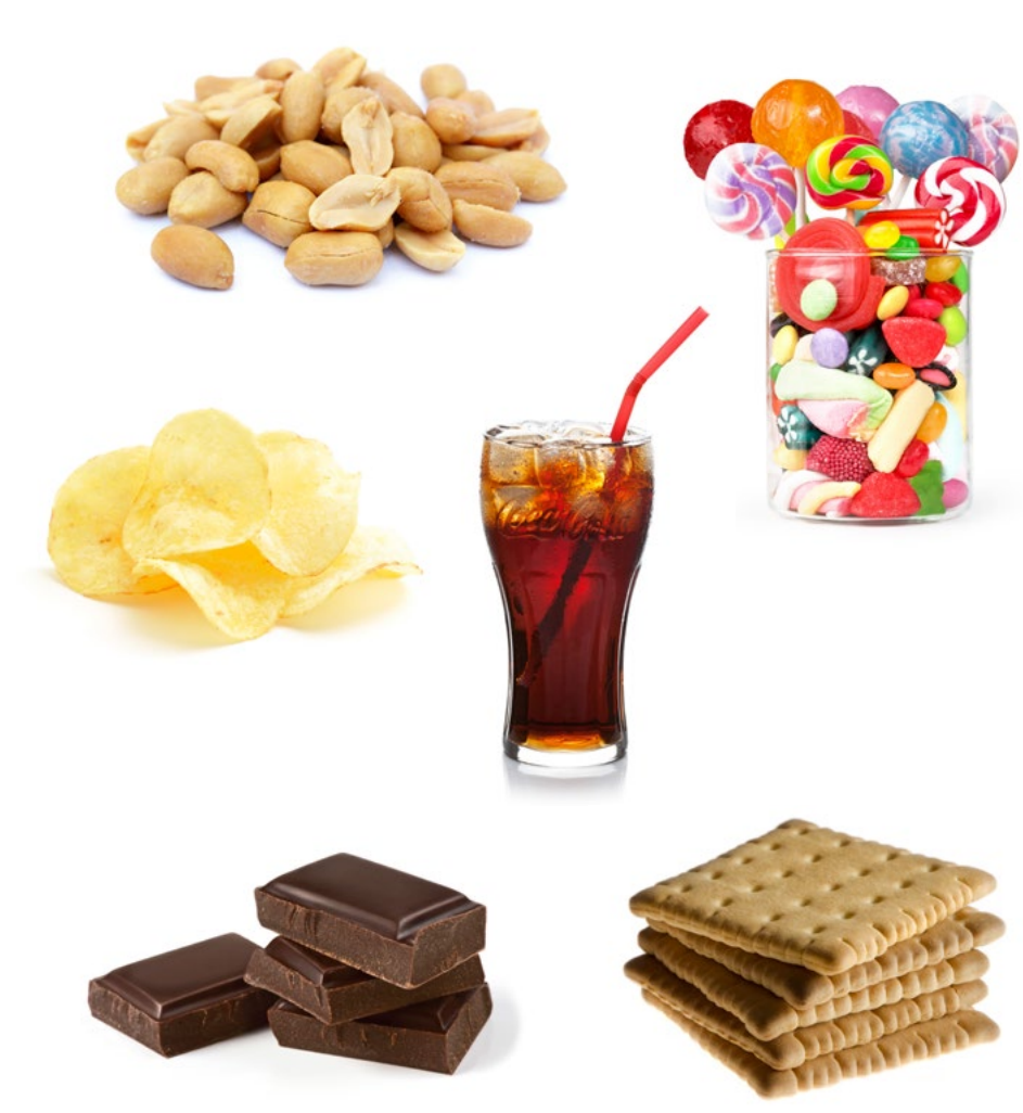
LES ALIMENTS PLAISIR