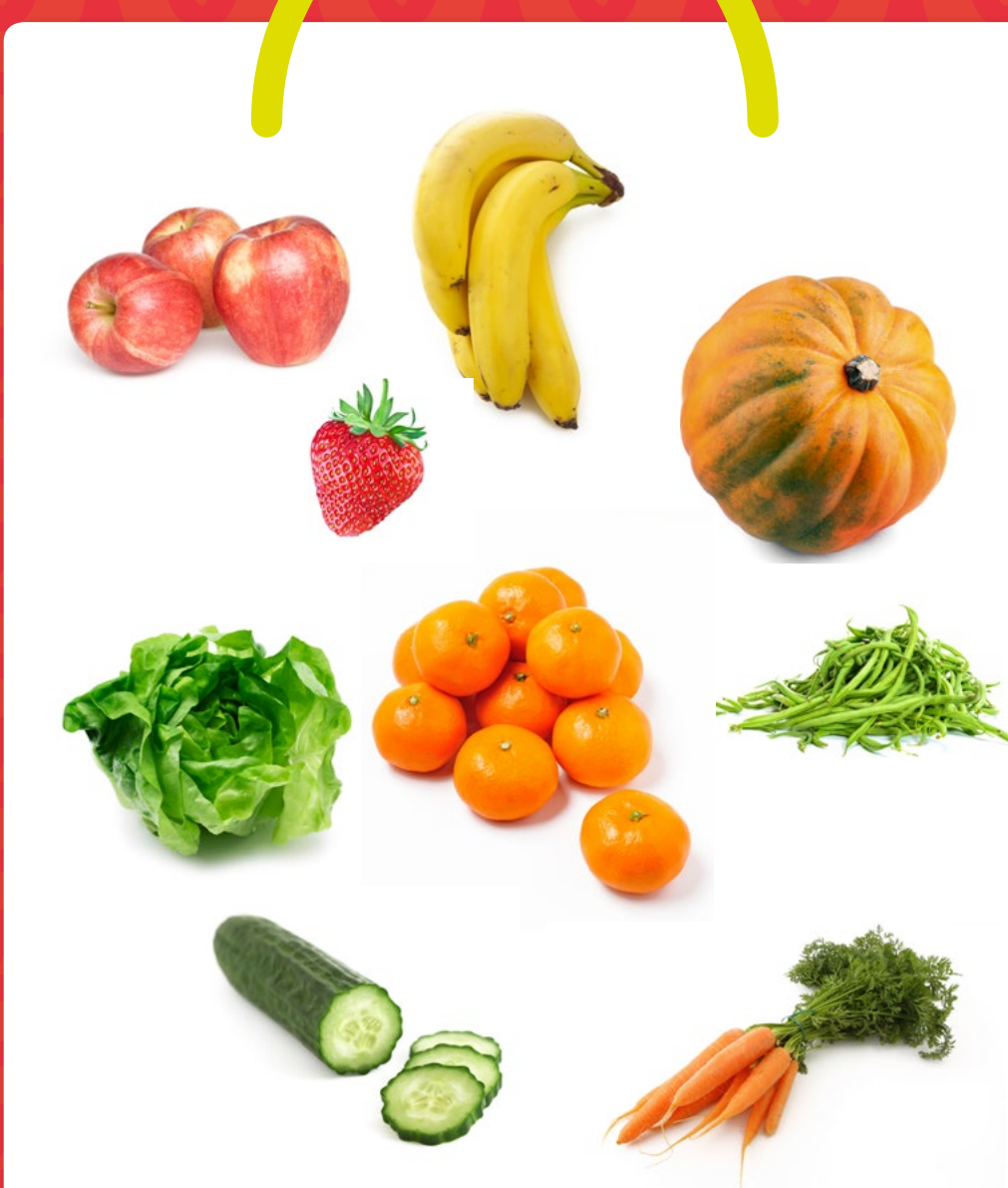
LES FRUITS ET LÉGUMES