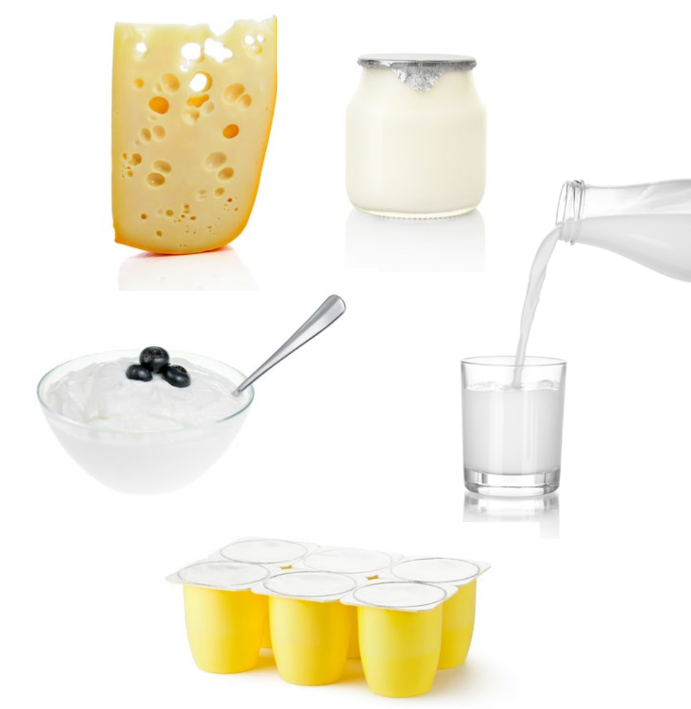
LES PRODUITS LAITIERS