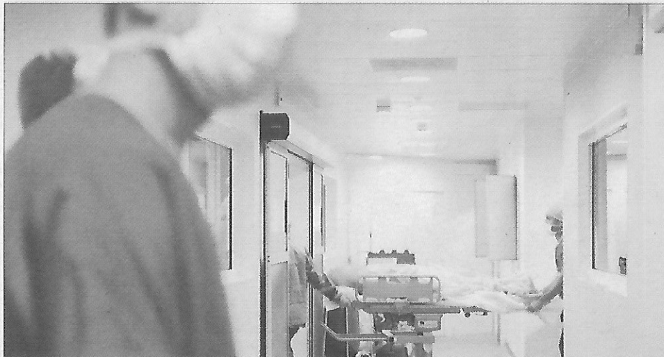
En 2019, 5 897 organes ont été transplantés en France, soit 92 de plus qu'en 2018. Mais les greffes de reins à partir de donneurs vivants ont reculé pour la seconde année consécutive.

Aujourd'hui, de plus en plus de vents s'élèvent pour dire que les éoliennes ne sont pas si écologiques que cela et qu'elles défigurent le paysage.