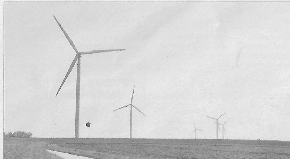
Les éoliennes ont pour but de créer de l'électricité. Aujourd'hui hautes de centaines de mètres, elles étaient à leur création plus petites.