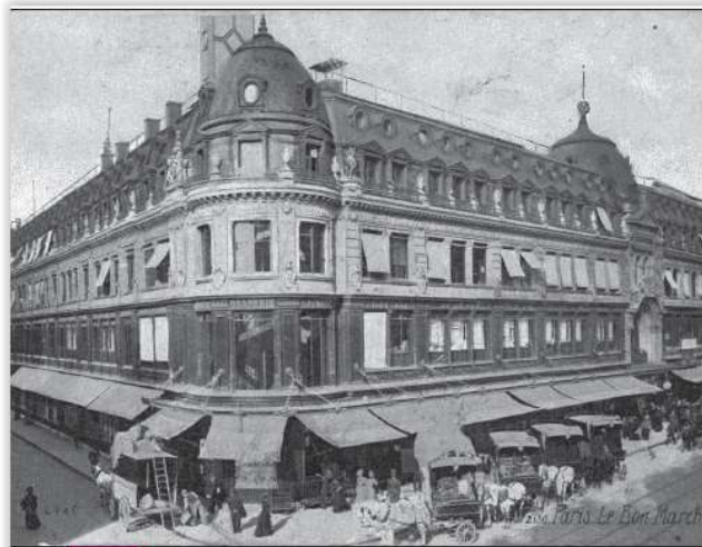
Doc. 1 Le Bon Marché en 1869.

Où et quand est construit le Bon Marché ?