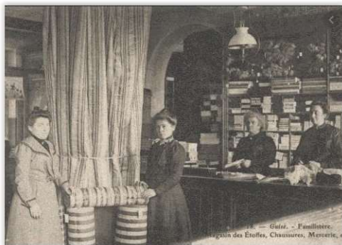
Les demoiselles du magasin en 1900.

Que peux-tu dire des clients et des clientes que tu vois dans le document 2 ?